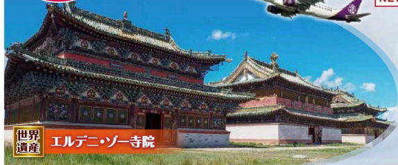
世界遺産 エルデニ・ゾー寺院

■乗車人員/60名 ■最少乗行人員/各コース20名 ■乗車費/内各コース新潟空港より新潟県内行 利用開始会社/フナエエア(スノー クラス) ※航空運賃はチャーター便のため乗客数に依存し変動いたします。詳細はスケジュールを参照してください。 ■乗車料/乗車料(乗車料) を別途お支払いください。 ■空港送迎(日本-モンゴル)5,000円(別途お支払いください)。 ■乗車料/乗車料(乗車料) を別途お支払いください。 ■乗車料/乗車料(乗車料)を別途お支払いください。 ■乗車料/乗車料(乗車料)を別途お支払いください。 ■乗車料/乗車料(乗車料)を別途お支払いください。 ■乗車料/乗車料(乗車料)を別途お支払いください。 ■乗車料/乗車料(乗車料)を別途お支払いください。