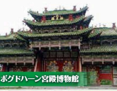
ボグドハーン宮殿博物館

かつてモンゴル帝国の首都が置かれていた古都「カラコルム」、周辺には世界遺産「オルホン渓谷」の文化的景観に登録されている歴史的な遺跡が点在しています。なかでも最も規模が大きいとされるモンゴル初のチベット仏教寺院、エルデニ・ゾーは必見! モンゴルの悠久の歴史に思いを馳せてみては。