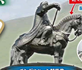
チンギスハーン騎馬像