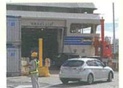
※車両航空送(乗船イメージ)

●車両航空代金には、運転手の2等運賃は含まれておりません。 ●対象車種は車検証に記載の車長3m以上6m未満の乗用車(ワゴン車含む)となります。 (人を運送する乗車定員10人以下の普通自動車・小型自動車・軽自動車。キャンピングカー及び車いす移動車も含む。) ●車検証に規定するトラック・貨物車は対象外です。