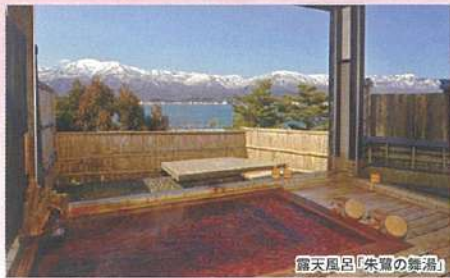
露天風呂「朱鷺の舞臺」