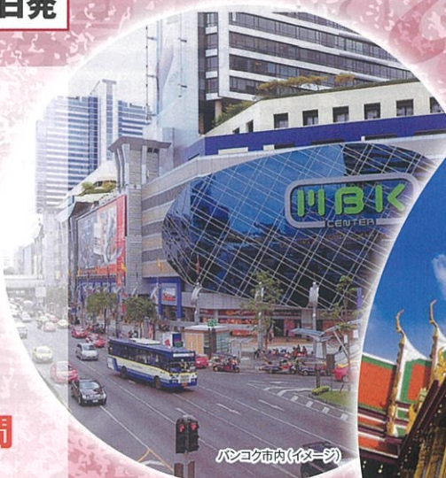
バンコク市内(イメージ)

ベトナムのリゾートとして今、注目を集め ているダナン。自由気ままにダナンをお楽 しみください。