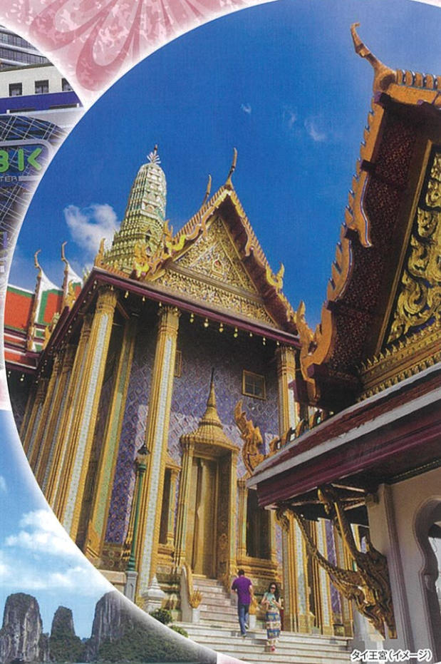
タイ王宮(イメージ)